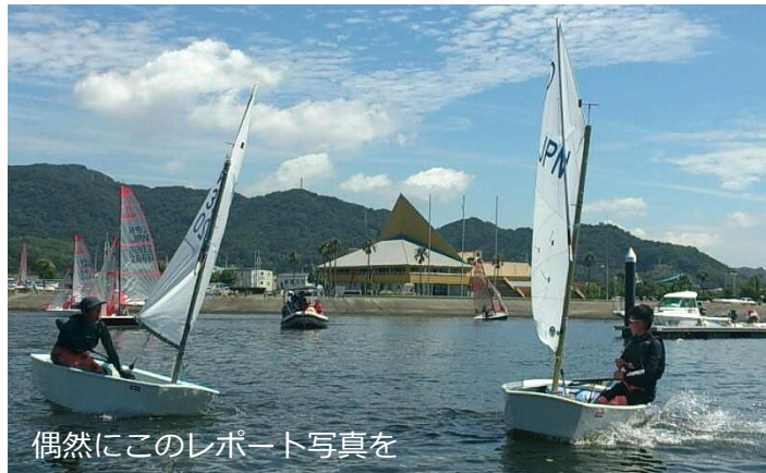
偶然にこのレポート写真を