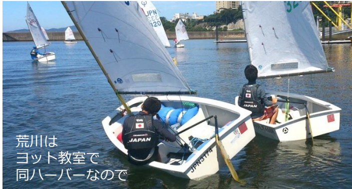
荒川は ヨット教室で 同ハーバーなので

江の島選考会から 早や 5ヶ月たち、 4つの NT のうち すでに 北米Team と Euro team が 遠征から帰国した。 Asia team は10月、 World team は あと2週間で旅立つ。