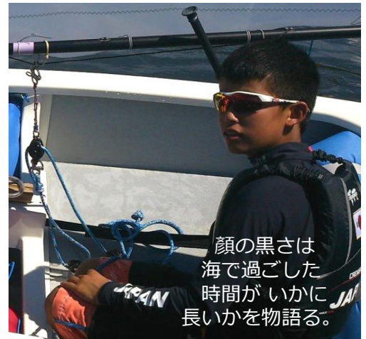
顔の黒さは 海で過ごした 時間がいかに 長いかを物語る。

江の島選考会から 早や 5ヶ月たち、 4つの NT のうち すでに 北米Team と Euro team が 遠征から帰国した。 Asia team は10月、 World team は あと2週間で旅立つ。