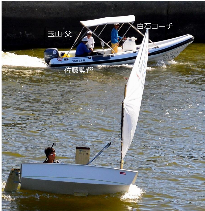
玉山 父 白石コーチ 佐藤監督